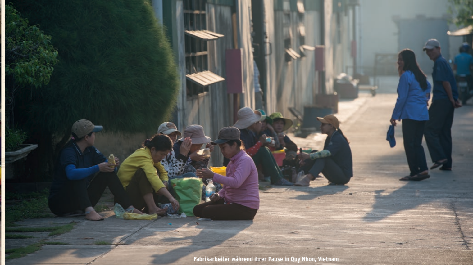
Fabrikarbeiter während ihrer Pause in Quy Nhon, Vietnam