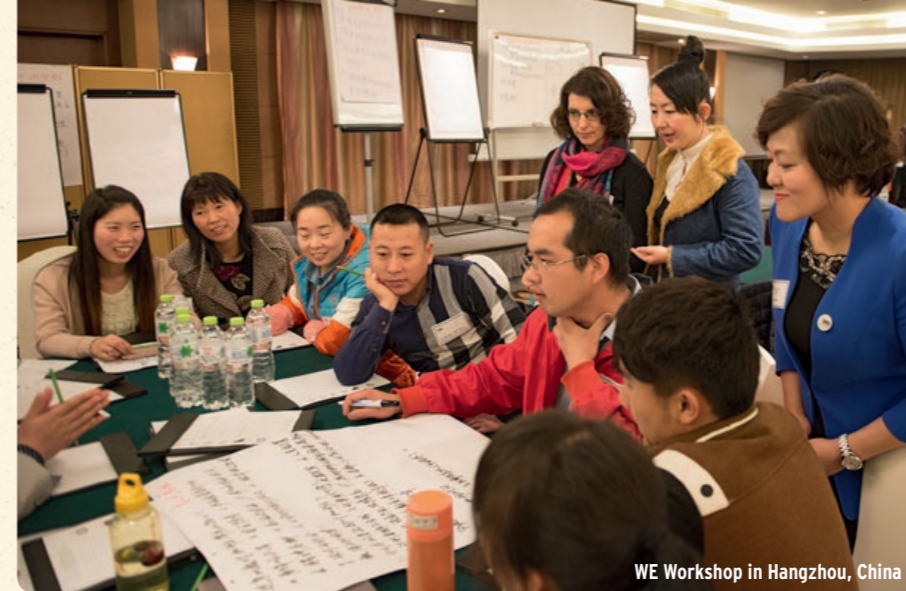
WE Workshop in Hangzhou, China