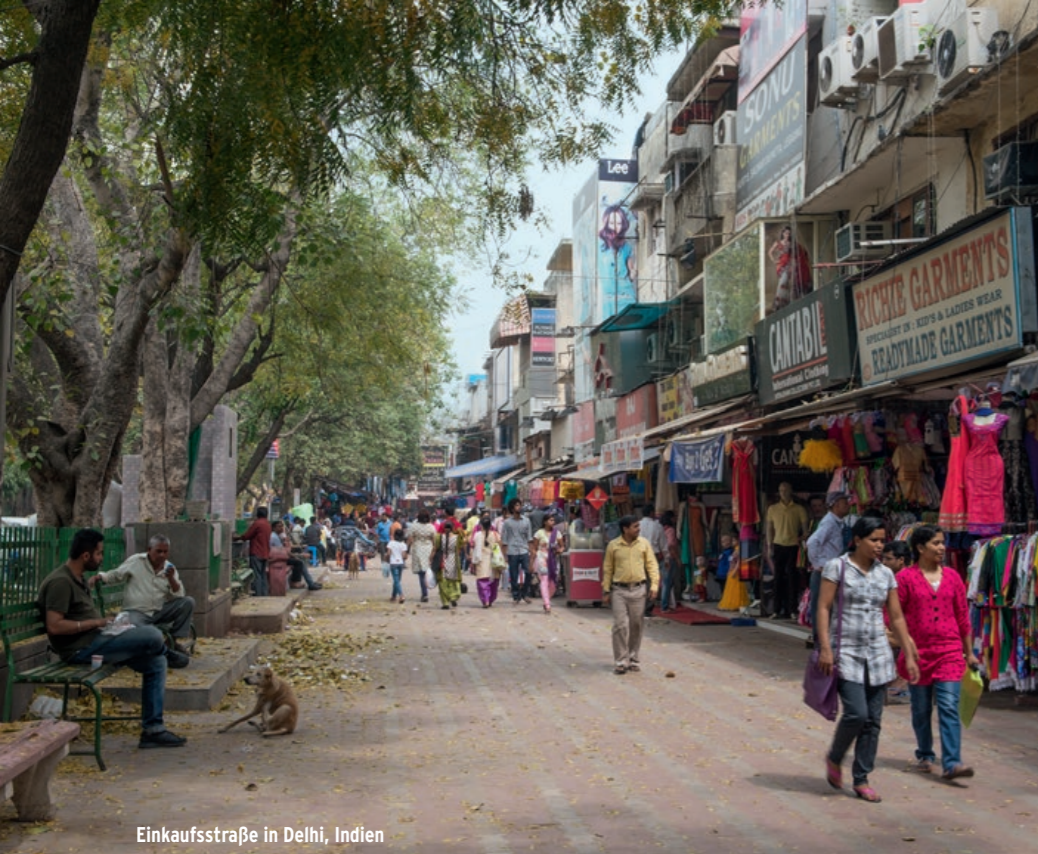
Einkaufsstraße in Delhi, Indien