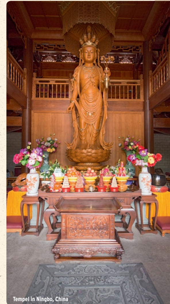
Tempel in Ningbo, China

China - Tchibo stellt dort viele unterschiedliche Produkte her - von Bekleidung über Schmuck bis hin zu Elektronikartikeln. 2007 startete Tchibo dort das WE Programm.