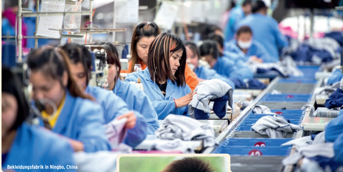
Bekleidungsfabrik in Ningbo, China

► ich habe im Vorfeld nicht erwartet, dass hier dazu ein solch konstruktiver und transparenter Austausch stattfindet.