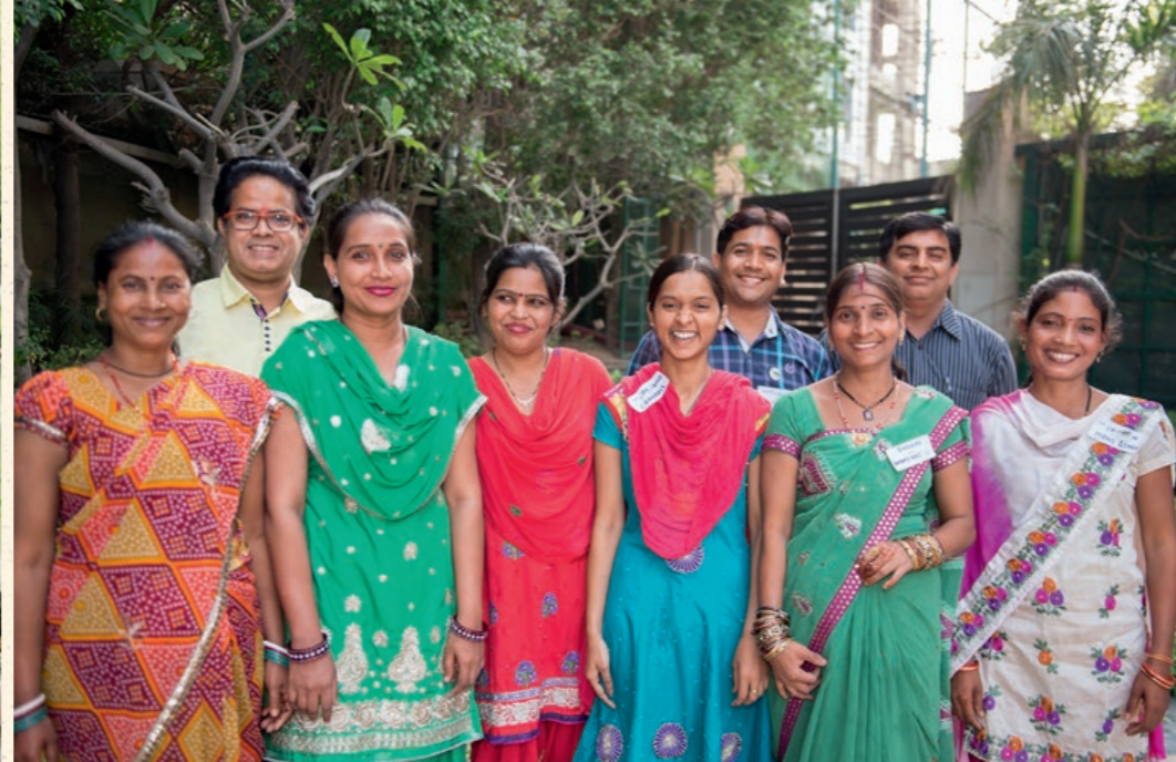
Beschäftigte und Manager bei einem WE Workshop in Delhi, Indien