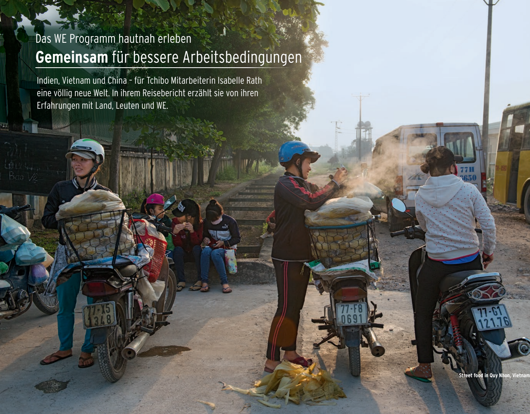
Street food in Quy Nhon, Vietnam