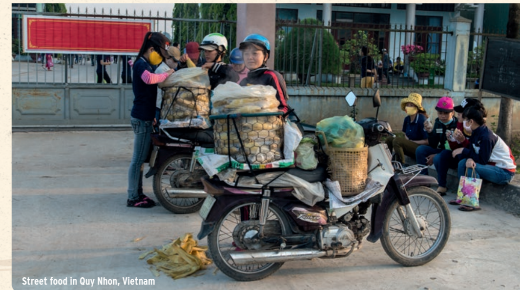
Street food in Quy Nhon, Vietnam