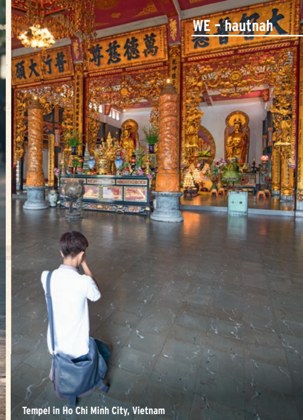
Tempel in Ho Chi Minh City, Vietnam