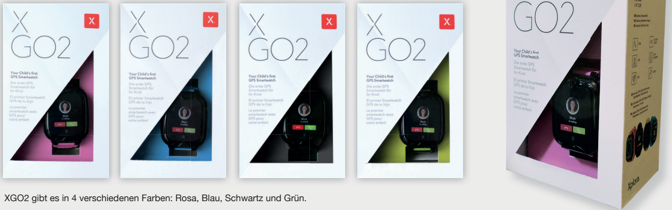
XGO2 gibt es in 4 verschiedenen Farben: Rosa, Blau, Schwarz und Grün.

*Änderungen bis zur endgültigen Abnahme vorbehalten.