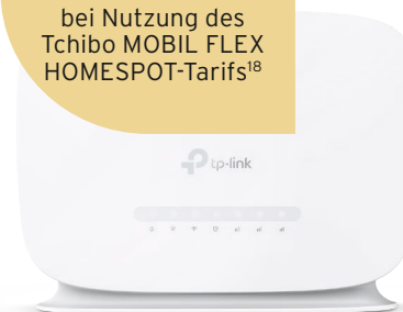
HomeSpot-Router LTE TP-Link

bei Nutzung des Tchibo MOBIL FLEX HOMESPOT-Tarifs 18